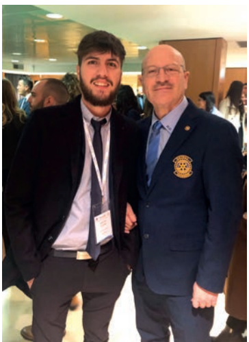
La Gazzetta del Mezzogiorno